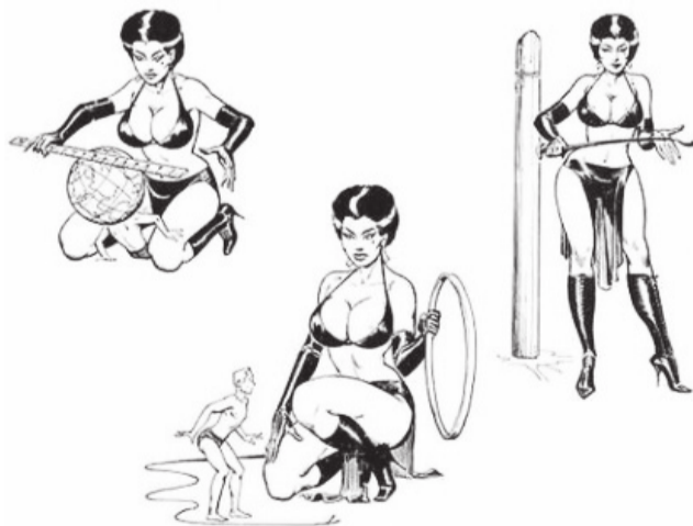
Ilustraciones: Eric Stanton.

Bueno, es que tenemos lugares. Donde sea visible ahí procuramos no meternos por cuestiones de trabajo, por cuestiones sociales. Si yo llegara aquí con la marca del bofetón que me dieron sería extraño. Hay bofetadas que incluso te pueden partir la boca. En particular yo lo gozaría, pero si entro a trabajar, por ejemplo, sería difícil de explicar. Y pondría a mi pareja en el ojo del huracán como un golpeador de mujeres, cuando no es tanto así, sería consensuado. Muchos no lo entenderían. Así que preferimos evitar aprietos.